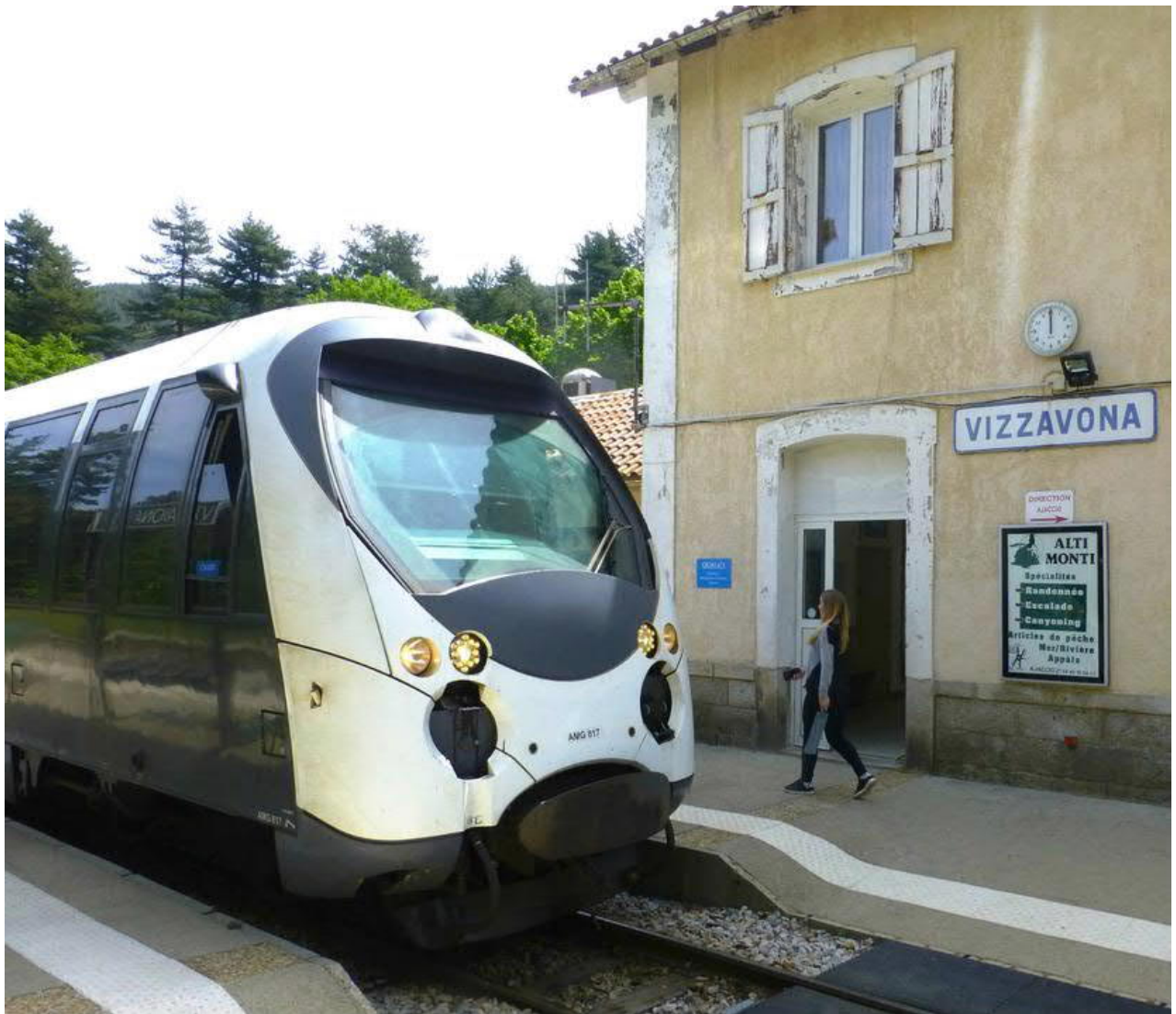
La petite gare ferroviaire de Vizzavona est l'une des principales plaques tournantes de l'île.

Christel Sarry, guide de randonnée, vous indique le chemin vers les ruines du Grand Hôtel de la Forêt. L'ancien bâtiment splendide était l'une des nombreuses auberges nobles construites à Vizzavona après que le village de montagne de la vallée d'Agnone fut relié à la côte par la construction de la voie ferrée en 1889. "A cette époque, la ligne était l'une des plus modernes d'Europe et les riches Corses de la capitale s'enfuirent à Vizzavona pendant les mois les plus chauds de l'année pour profiter de la station d'été", explique Sarry. Le nom des Cascades des Anglais, situées à proximité, indique que de nombreux Anglais y passaient leurs vacances et cherchaient un rafraîchissement dans les piscines cristallines.