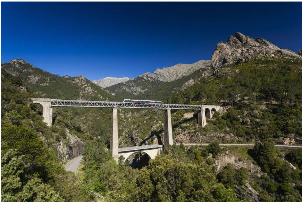
Sur le trajet de 160 kilomètres, la voie ferrée à voie étroite traverse 34 viaducs - ici le Pont du Vecchio, appelé "Pont Eiffel".

"Les Grecs appelaient autrefois la Corse "Kalliste", ce qui signifie "la plus belle".